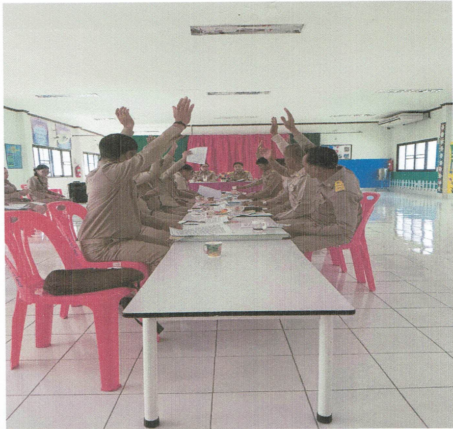
การรับรองรายงานการประชุม